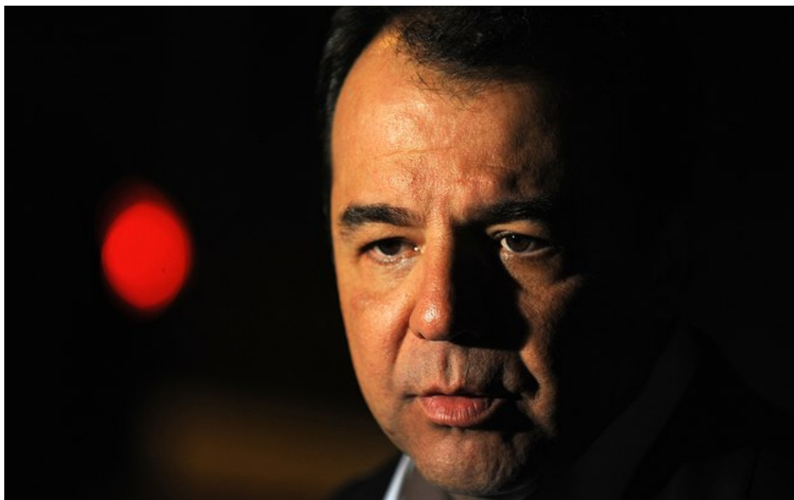
Fabio Rodrigues Pozzebo/Agência Brasil